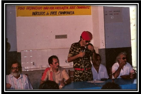
-01. Realização do I Encontro dos Núcleos de Base Camponesa do Piauí pela Reforma Agrária