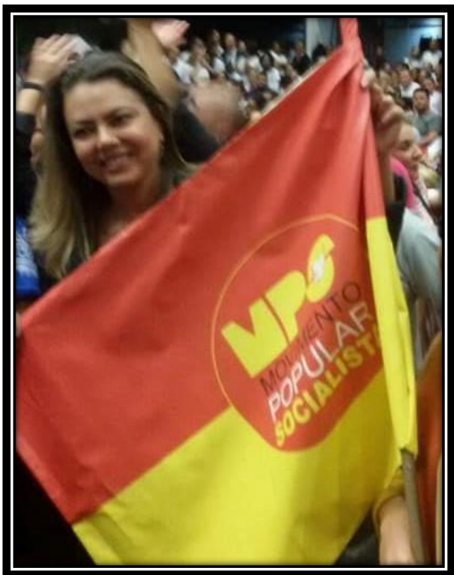
Senadora LEILA BARROS – PSB – MPS DF Coordenadora Nacional do Núcleo de Base de Esporte, Recreação e Lazer do MPS – PSB