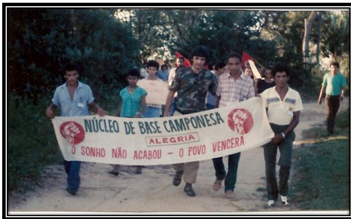
Trabalho de organização dos Núcleos de Base no Piauí

- Coletivo Estudantil: Coordenador (a); Subcoordenador (a); Assistente Universitário; Assistente Secundarista e Assistente de Pós-Graduação;