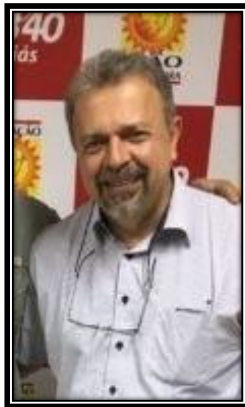
Deputado Federal ELIAS VAZ - PSB Secretário Estadual do MPS de Goiás e Coordenador Nacional Ativo Parlamentar