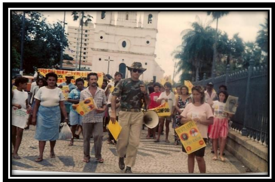
4. Marcha dos Núcleos de Base de Sem Tetos e Comunidades Urbanas por Água e Terra no Piauí;