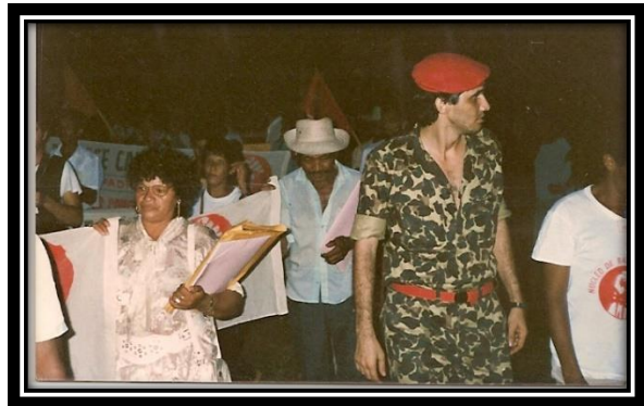
3. Marcha dos Núcleo de Base Camponesa por Terra e Justiça no Campo no Piauí