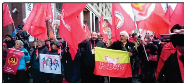
ACILINO RIBEIRO – Secretário Nacional do MPS – Movimento Popular Socialista