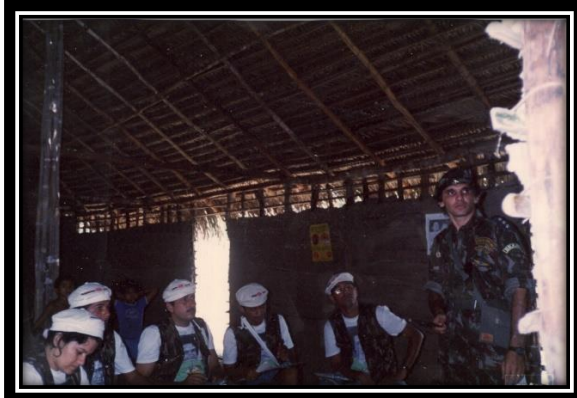
-1. Curso de Formação Política para NB. -2. Treinamento de Formação Guerrilheira p\ os NBs