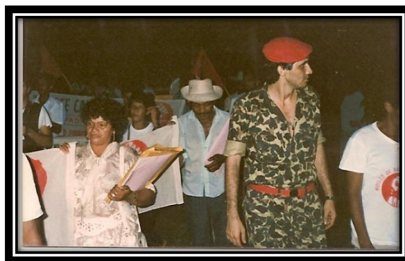
3. Marcha dos Núcleo de Base Camponesa por Terra e Justiça no Campo no Piauí