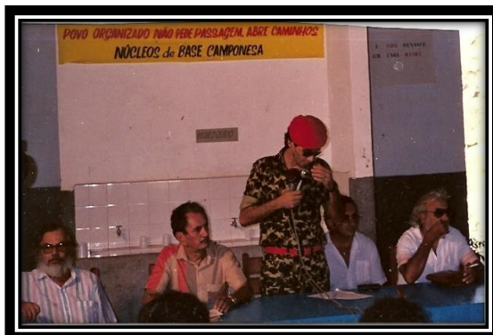
-01. Realização do I Encontro dos Núcleos de Base Camponesa do Piauí pela Reforma Agrária