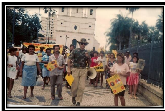
4. Marcha dos Núcleos de Base de Sem Tetos e Comunidades Urbanas por Água e Terra no Piauí;