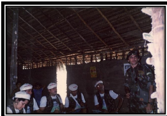
-1. Curso de Formação Política para NB. -2. Treinamento de Formação Guerrilheira p\ os NBs